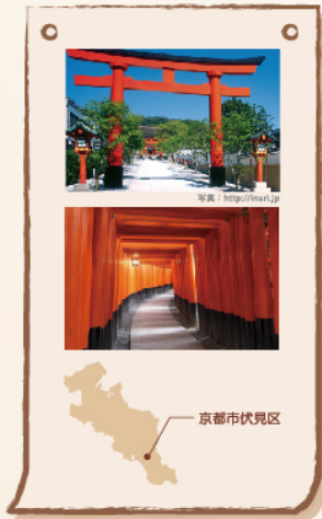
伏見稲荷大社 公式HP http://inari.jp

有名すぎるほど有名で今まで何度となくご紹介をしようとして、何故かタイミングが合わなくて紹介ができませんでした。ようやく満を持してのご紹介です。