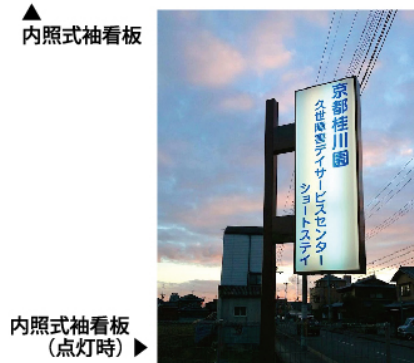
内照式袖看板 (点灯時) ▶

今回ご紹介させていただきますのは京都桂川園様です。 外部には内照式の袖看板とSUS切文字サインをご提案させていただきました。 袖看板は振れ止め棒がなくても構造上問題がないように骨材に補強が入っており見た目がすっきりするように致しました。 また、SUS切文字はとても小さな文字なので取付けの際は大変苦労しました。 歪み無く無事に取付けられてよかったです。 そして内部のサインは建具に合わせた木製プレートで、より統一感のある空間になりました。