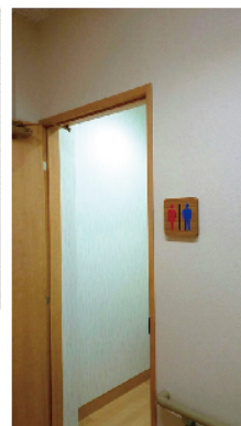
▲木製トイレサイン