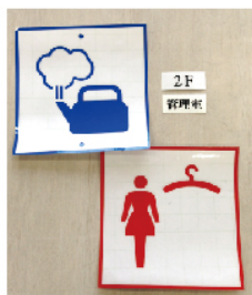
文字・ビクトリタック仕様

カッティングシートとは、塩化ビニール製の薄いシートの裏にのりが付いており、シールになっているものです。