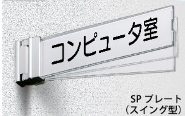
SPプレート (スイング型)