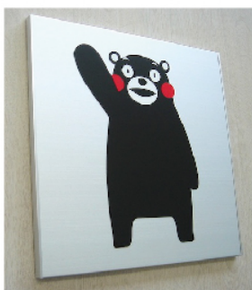
▲アルミ製サイン FT200 インクジェットシート貼

このピクトサインを見て、生徒さんたちが楽しくプールに入ってくれたら嬉しいですね。