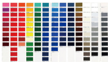
カッティングシート色見本帳

UV印刷やインクジェット印刷と同様に、室名札や看板等の表示に欠かせないのがカッティングシート。UV印刷やインクジェット印刷にはないカッティングシートの優れた特徴をご紹介します。