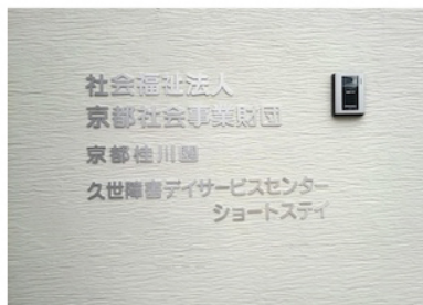
▲ステンレス切文字

これからも施設の雰囲気に合わせてサインをご提案させていただきたいと思 います。ありがとうございました。