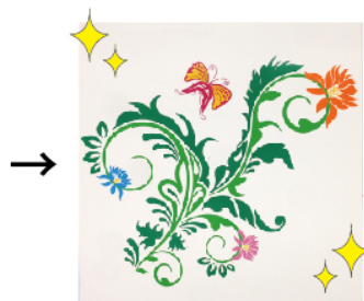
カッティングシートのみで仕上げた作品