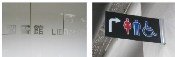
今回納めた館名サインとトイレ誘導サイン

国立大学法人 東京農工大学ホームページ http://www.tuat.ac.jp/