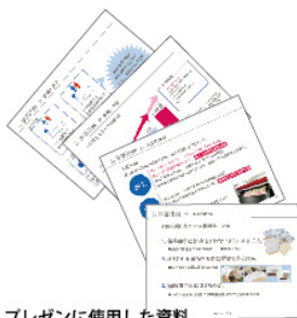
プレゼンに使用した資料

弊社は、用途に沿ったオリジナルデザインのサインを提案し、国内の自社工場にこだわり、高品質の商品を小ロットから短納期で製作・出荷できることが強みです。少子高齢化社会の中、新たに介護施設向けのサインを開発し、営業部員を増員して販路を拡大する計画です。