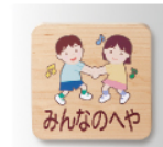
メープル (MPWプレート)