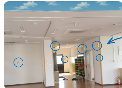
フジタサイン付いてます！