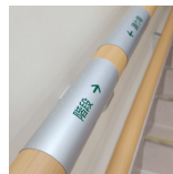
↑スイングサインをご利用頂いています！