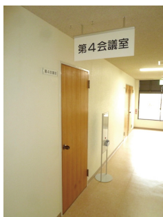
室名サインと吊り下げサイン