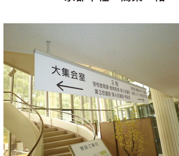
吊り下げ誘導サイン