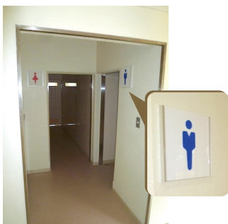
トイレピクトサイン