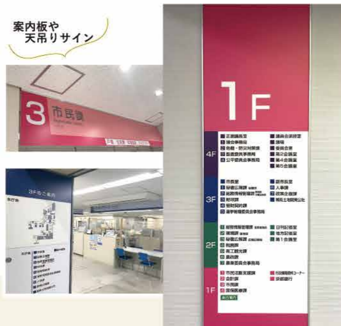
案内板や 天吊りサイン