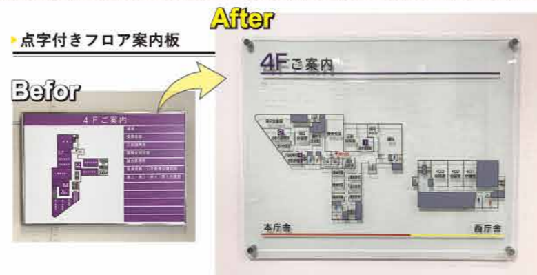
▶点字付きフロア案内板