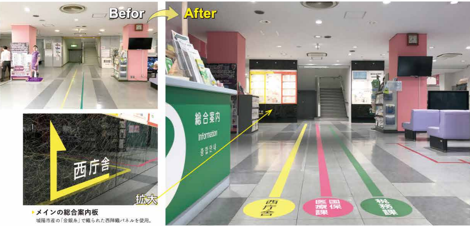
▶メインの総合案内板 城陽市産の「金銀糸」で織られた西陣織パネルを使用。

メインの総合案内板は「城陽市産の金銀糸」で織られた西陣織パネルを使用。 京の風情を感じさせるサイン施工をさせていただきました。