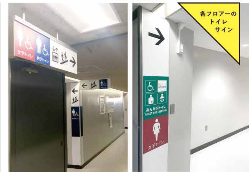
各フロアの トイレ サイン