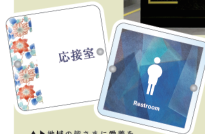
▲地域の皆さまに愛着を持っていただけるような、ご当地ならではのオリジナルデザインのサインを作りませんか？