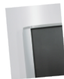
無地の表示面は黒